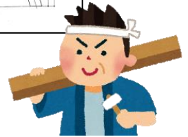
教材：四方転び踏み台

-豆知識- 講座で習う規矩術(きくじゆつ)は、「さしがねの使用法」ともいわれている。昔から“隅矩法(すみがねほう)”や“坪矩方(つぼがねほう)”などとも呼ばれている。建築構造・意匠・施工の一部を説明することをさしているんだ。大工には必要な知識だぜ!